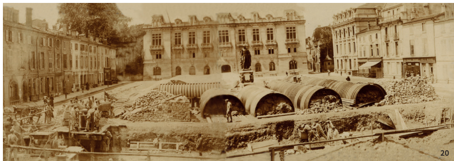
20. Place Reggio , construction des abris anti-aériens