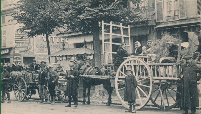
Guerre de 1914-15

Emigrants : Vers l'inconnu, fuyent leurs maisons dévastées - Leur passage à Bar-le-Duc